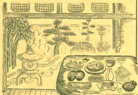
新多久、吉源、松浦家、能登新