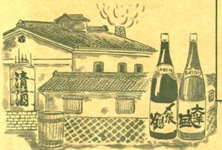
益基、酒屋工藤、益田甚兵衛酒店