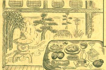
新多久、吉源、松浦家、能登新