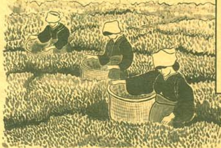
九重園、松本園、富士美園