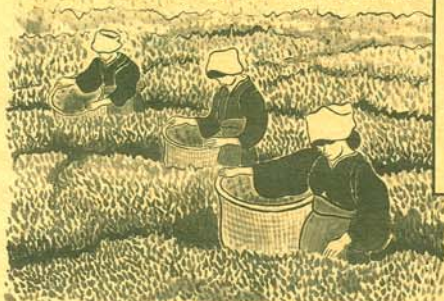
九重園、松本園、富士美園