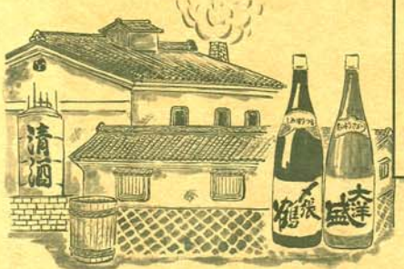
益基、酒屋工藤、益田甚兵衛酒店