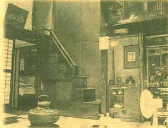
〈町屋〉箱階段…松本園