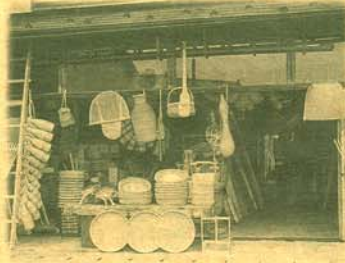
〈町屋〉見世…石栗商店