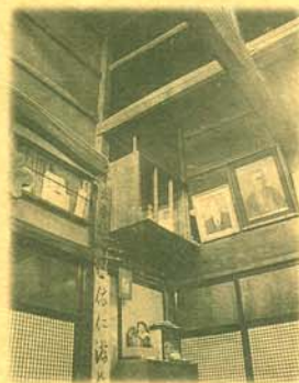
〈町屋〉梁(はり)…九重園